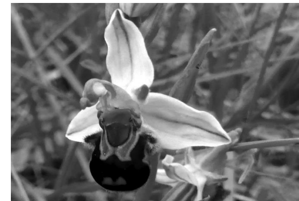
Ophrys apifera (O. abeille) Gevrey-Chambertin 27/05/18